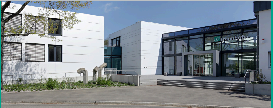
Fraunhofer IWM, Freiburg.

FRAUNHOFER-INSTITUT FÜR WERKSTOFFMECHANIK IWM